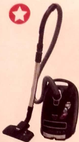
Miele Complete C3 Black Diamond Ecoline