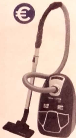
Rowenta RO6831EA X-Trem Power 3AAA